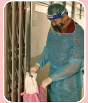
病人獲寰宇希望資助藥物費用。