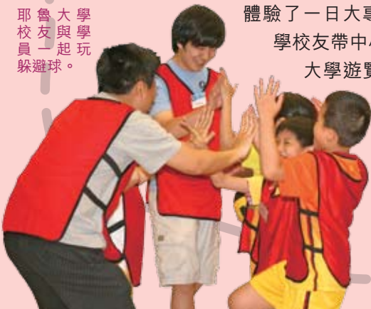
耶魯大學校友與學員一起玩躲避球。

多謝香港耶魯大學校友會及耶魯大學服務日。他們擴闊了小朋友們的思維和給了他們對未來的一個夢想。