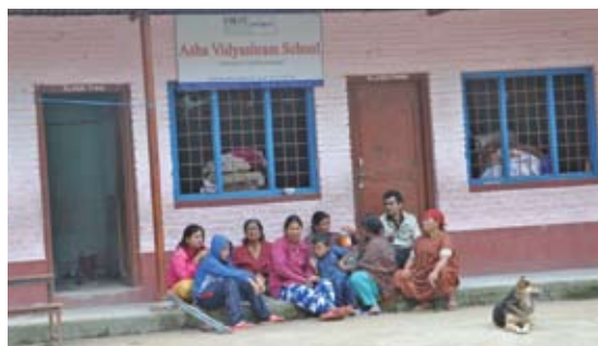
地震發生後，寰宇希望（尼泊爾）的學校立刻成為附近居民的緊急避難所。

救援工作仍然繼續，這裏也需要長遠的重建工程。我們謹代表寰宇希望（尼泊爾）感謝每位捐助者。你們為尼泊爾居民帶來希望及溫暖了他們的心。