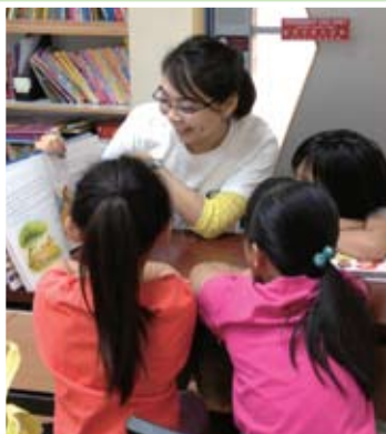
義工及中心會員享受一起閱讀英語圖書的時間。

感謝你的支持，使兒童希望中心的英語學習計劃有更多創新的活動。這項計劃幫助低收入家庭孩子提升英語程度，給他們更大的自信心應用這個語言。到底有哪些活動，深受小朋友喜歡？