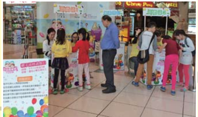
我們將品格教育帶進社區。

我們很興奮看到小朋友透過此計劃，在品格上有正面的改變。我們看到孩子們在平時互動時，表現出這六大品格，同時也得到父母及老師的鼓勵回應。不只如此，透過玩桌遊，孩子們的溝通技巧、解決衝突能力及思考模式也得到建立。這些遊戲，已變成中心的一部份。現在，中心會員一完功課，他們便拿這些遊戲來玩。我們很感激看到他們發光的眼神，歡樂的笑聲，及他們的良好品格和彼此之間的關係。