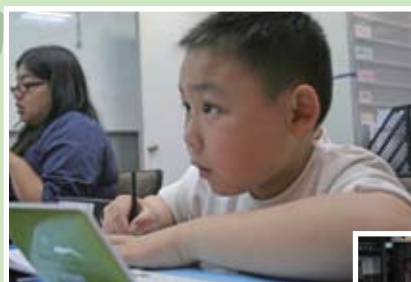
想贏電腦遊戲？先把英文單字學好！