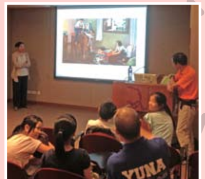
中心會員享受了一堂由耶魯大學校友教授的特別小課程。

多謝香港耶魯大學校友會及耶魯大學服務日。他們擴闊了小朋友們的思維和給了他們對未來的一個夢想。