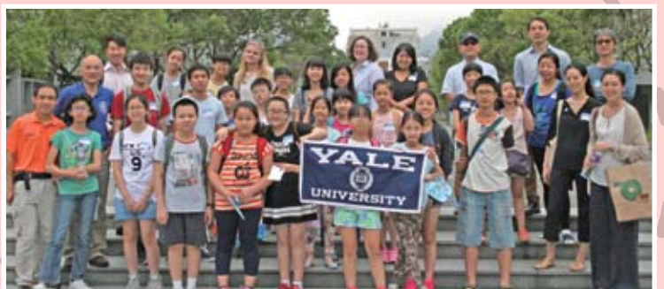
自2012年起，我們成為了「耶魯大學全球服務日」的受惠機構。