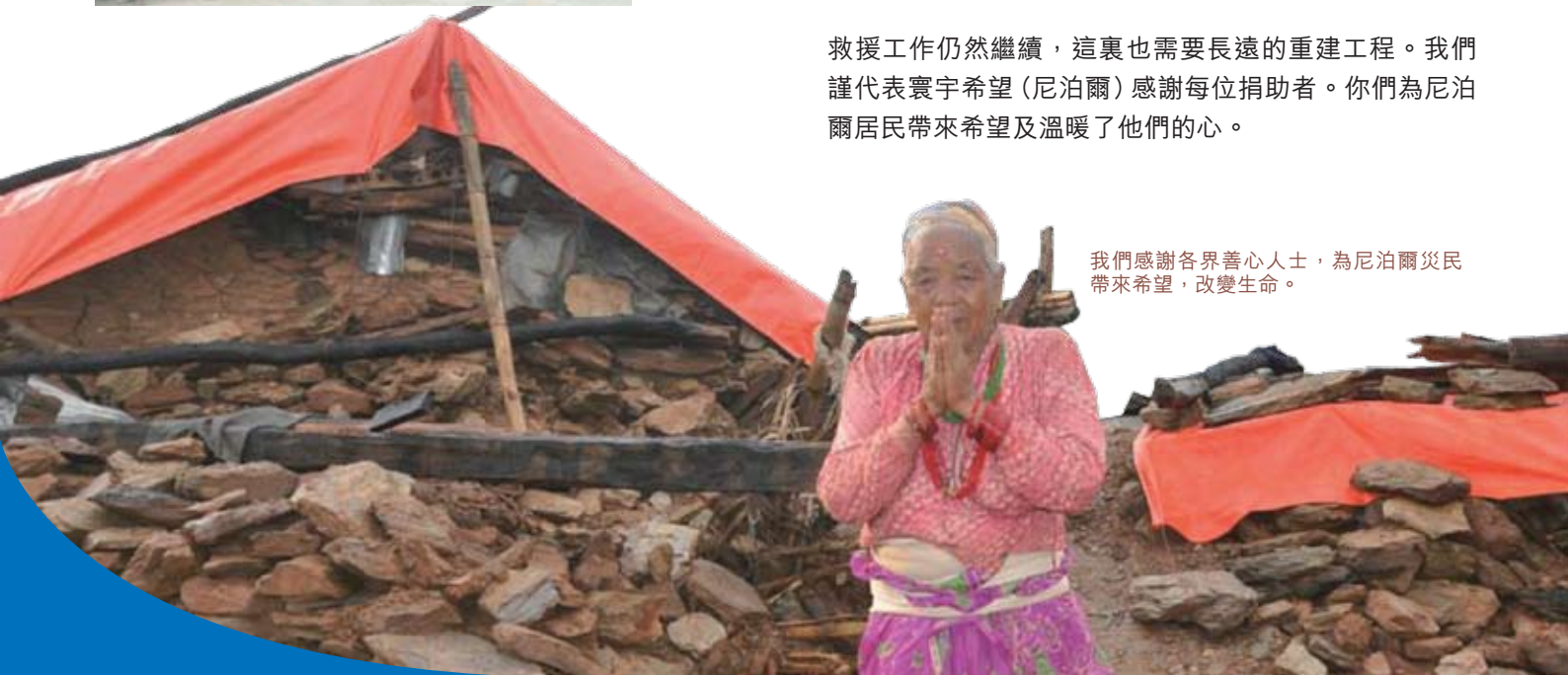
我們感謝各界善心人士，為尼泊爾災民帶來希望，改變生命。