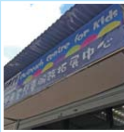
小小辦公室。大大的夢想。

事實上，這個拓展中心是一間只有兩名員工的小小辦公室。雖然我們缺乏地方，但是我們擁有熱心的員工及義工及創新的計劃。就這樣，我們開始與中心鄰近的學校接觸，並主動在這些學校推展品格教育計劃。計劃為該區孩子，開展一片新天空。