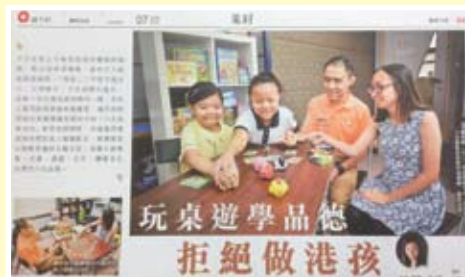
具創意的「棋樂無窮」品格教育計劃引起傳媒的關注。

我們叫這項新計劃「棋樂無窮」品格教育計劃。從2012年起，我們已幫助了數百名居住在深水埗及天水圍的學童，學習有關信任，尊重及關愛的品格。他們學到什麼叫做負責任，如何公平對人及學習成為良好公民。而這些都在玩樂中學習得到！