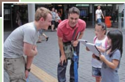
我們的學員透過訪問外國人練習英文會話。