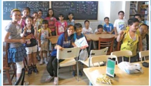
我們透過「棋樂無窮」品格教育計劃，影響居住在水圍的小朋友。