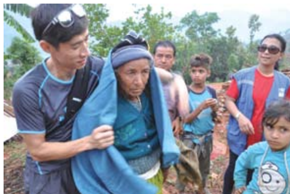
地震發生當天至六月15日，寰宇希望（尼泊爾）總共分發了8,600張毛毯，3,300個帳幕，及44,000噸食物及物資。

雖然他們同樣也是地震災民，寰宇希望（尼泊爾）的同事馬上開始進行救災工作，派發毛毯、食物、水、藥物及防水帆布作為緊急帳篷。多謝新加坡航空飛行員協會、歷史頻道、國際基督教會、勝安航空、星加坡航空公司、印度的時代基金會及來自全球不同地方的捐助者，為災民帶來8600條毛毯，3300個防水帳篷及接近44000噸食物。（截至2015年6月15日資料）