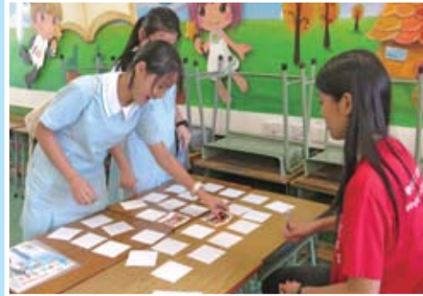
即使沒有中心，但是我們仍然為天水圍裡的兩所學校提供服務。

在2015年6月，因為租金持續上升，我們只能決定將中心關閉了。但自我們在該區服務以來，很多學校、父母及孩子都已認識我們了。繼往將來，我們會繼續在水圍的兩間小學，為低收入家庭孩子提供更多的創新計劃。