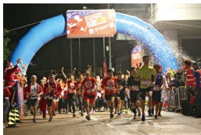
寰宇希望每年策劃多個籌款活動，「千個聖誕老人跑」也是一例。感謝您和我們攜手為社區帶來希望，改變生命。全因有你，這些改變的奇蹟才能發生！謝謝你！