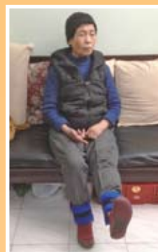
被確認為高風險跌倒個案後，周婆婆學習強化雙腿運動，以預防再跌倒。

我們安排職業治療師到周婆婆家探訪。職業治療師認為周婆婆家浴室需要安裝扶手，以防止更多意外發生。周婆婆也得到助行器及沙包，並學習強化雙腿肌肉運動。