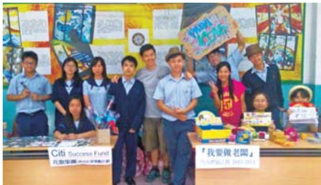
花旗集團成功在望獎勵計劃，帶給弱勢青年一個發掘潛能的好機會。

這三位年青人的「公司」，預定要在農曆新年年宵攤位上開業。在準備和運作過程中，他們需將所學的知識實踐出來，例如怎樣分配金錢、人力資源、貨存、收入開支及運輸等。最後，他們得將貨品有效地推出市場。