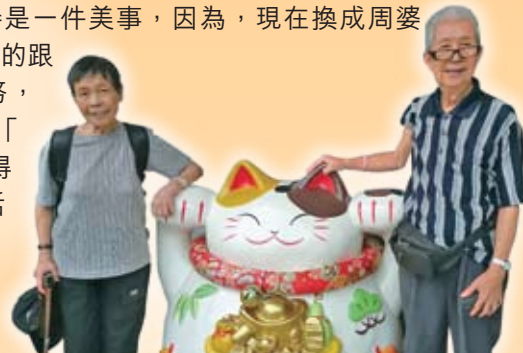
79歲的周婆婆，在幾年前跌倒後，便一直經歷著非凡的轉變。

得到你持續的支持是一件美事，因為，現在換成周婆婆的丈夫需要我們的跟進服務。這些服務，正正讓兩位長者「在家安老」—活得好，活得健康及活得開心。