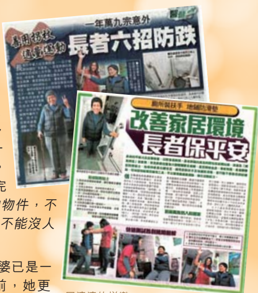
周婆婆的蛻變，引起新聞界的注意。

因為得到你的支持，今天周婆婆已是一位活躍及開朗的女士了。早前，她更與本會義工到大嶼山，一起步行上268級石階，參拜大佛。